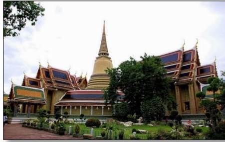
วัดราชโอรสารามราชวรวิหารเขตจอมทอง กรุงเทพฯ

76. จากภาพ ลักษณะที่สามารถเห็นได้อย่างเด่นชัดของวัดราชโอรสารามราชวรวิหารคือข้อใด